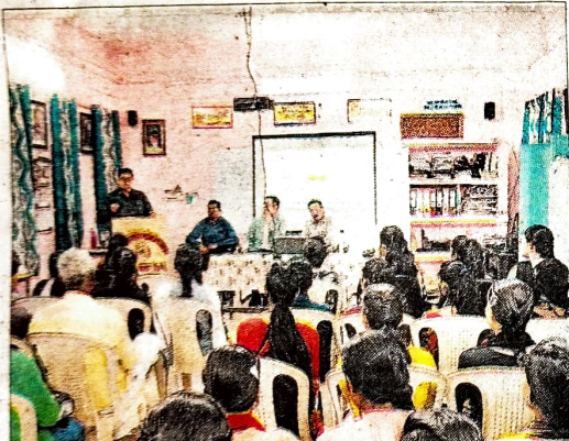
नवभारत रिपोर्टर | चारामा

शासकीय शहीद गेंटासिंह महाविद्यालय चारामा में अर्थशास्त्र विभाग के द्वारा 30 अक्टूबर को विश्व बचत दिवस के अवसर पर जन-जागरूकता कार्यक्रम एवं बैंकिंग क्षेत्र में रोजगार के अवसर विषय पर करियर मार्गदर्शन शिबिर का आयोजन किया गया। 31 अक्टूबर को बचत को प्रोत्साहित करने हेतु विश्व बचत दिवस मनाया जाता है। किंतु भारत में यह दिवस